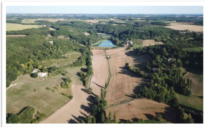
Luchtopname vanaf Domaine du Merlet met zicht op de meren

In vijf minuten ben je met de auto bij Lac de Ferrie, ook in Penne d'Agenais: een meer dat onderdeel uitmaakt van La Maison de Pêche et de la Nature. Je kan er naast zeelt ook black-bass, voorn en karper aantreffen.